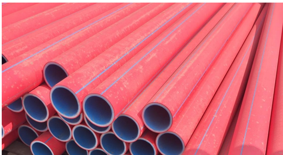
Общий вид трубы «РЭДПАЙП ПРО»

Защитные термостойкие трубы для прокладки кабельных линий, до 20 кВ ТУ 22.21.21-001-53842199-2018